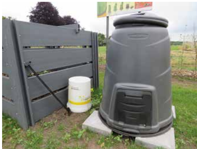
Tabel 12: compostering

De ene samentuin waar het antwoord 'anders' luidt, is een samentuin waar de gemeente het groenafval ophaalt en op een andere locatie voor de samentuin composteert.